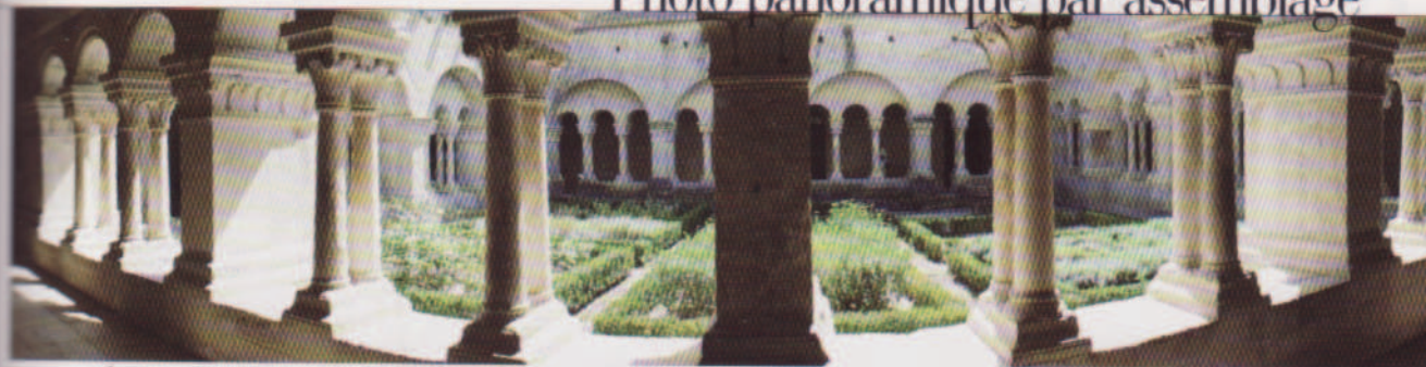
La panoramique par assemblage permet aussi d'obtenir des effets visuels intéressants sur certains monuments, comme ce cloître.